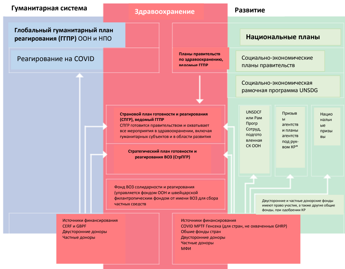
ГРАФИК 3. МОДЕЛИ ФИНАНСИРОВАНИЯ ОТВЕТНЫХ МЕР НА COVID-19 И ВОССТАНОВЛЕНИЕ (информация на 23 апреля 2020)