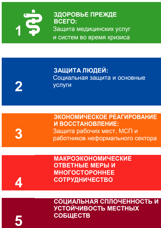
ГРАФИК 1: 5 КОМПОНЕНТОВ РЕАГИРОВАНИЯ UNDS